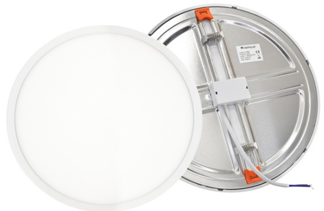
Ø 230 mm. (ajustable 50-210 mm.)